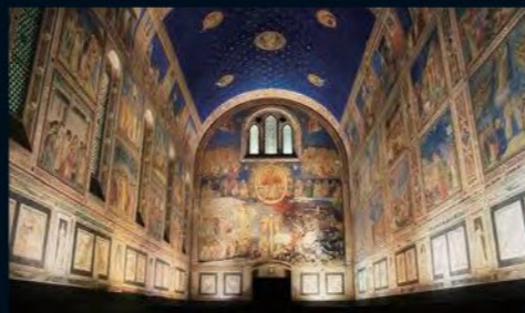
スクロヴェーニ礼拝堂壁画