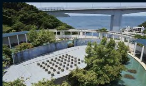
屋外展示 モネの「大睡蓮」