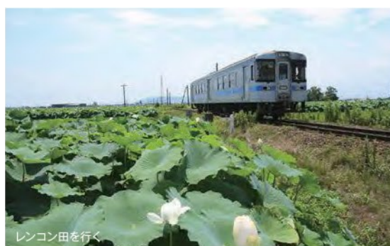
レンコン田に行く