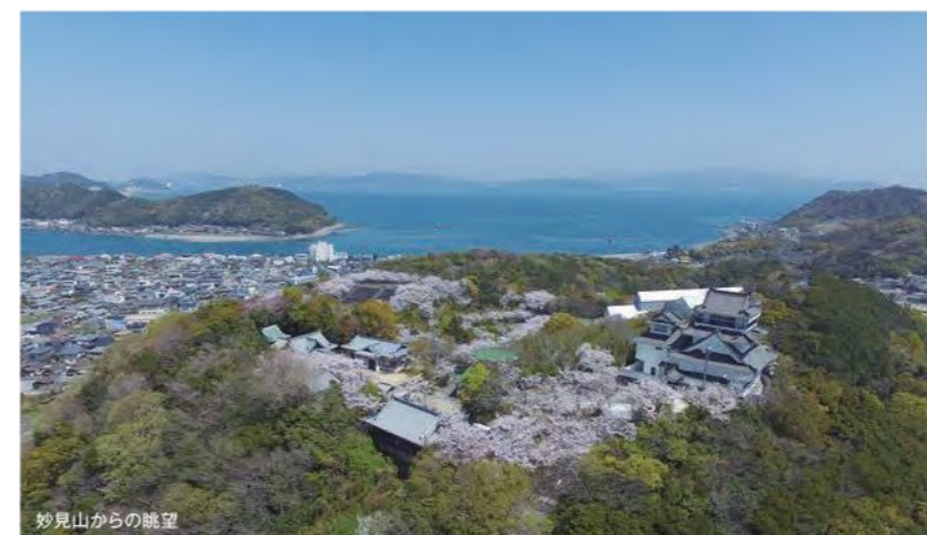
妙見山からの眺望