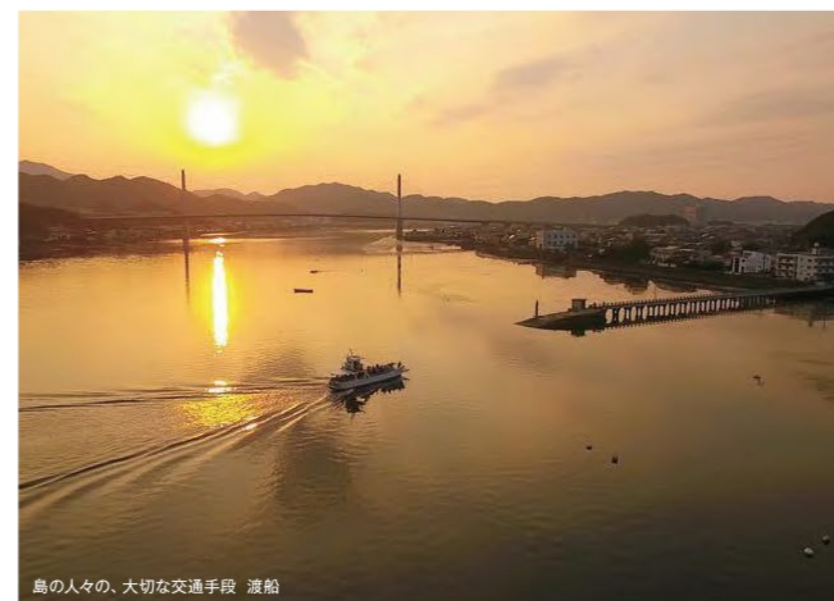
島の人々の、大切な交通手段 渡船