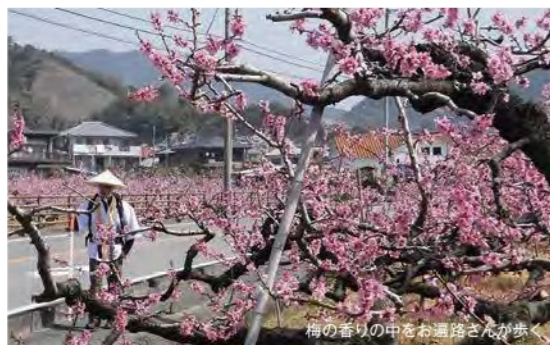
梅の香りの中をお通路さんが歩く

清浄な土地にしか住めないとされているコウノトリが住める環境であることは、それは人間にとっても、安全で安心な自然豊かな環境であるといえます。コウノトリにも、人にも優しい環境を持つ鳴門市に、足をお運びください。