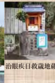
治眼疾目救歳地藏