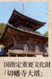
国指定重要文化財 「切幡寺大塔」