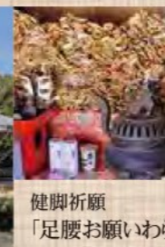
健脚祈願 「足腰お願いわらし」